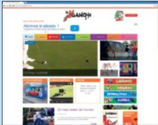
Periódico infantil digital.

Un gran número de periódicos digitales van dirigidos a los adultos, pero también existen publicaciones digitales infantiles, y son un gran éxito!